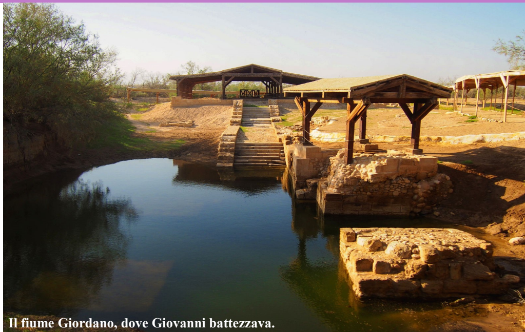
Il fiume Giordano, dove Giovanni battezzava.

me, mi ha mandato a portare ai poveri il lieto annuncio.